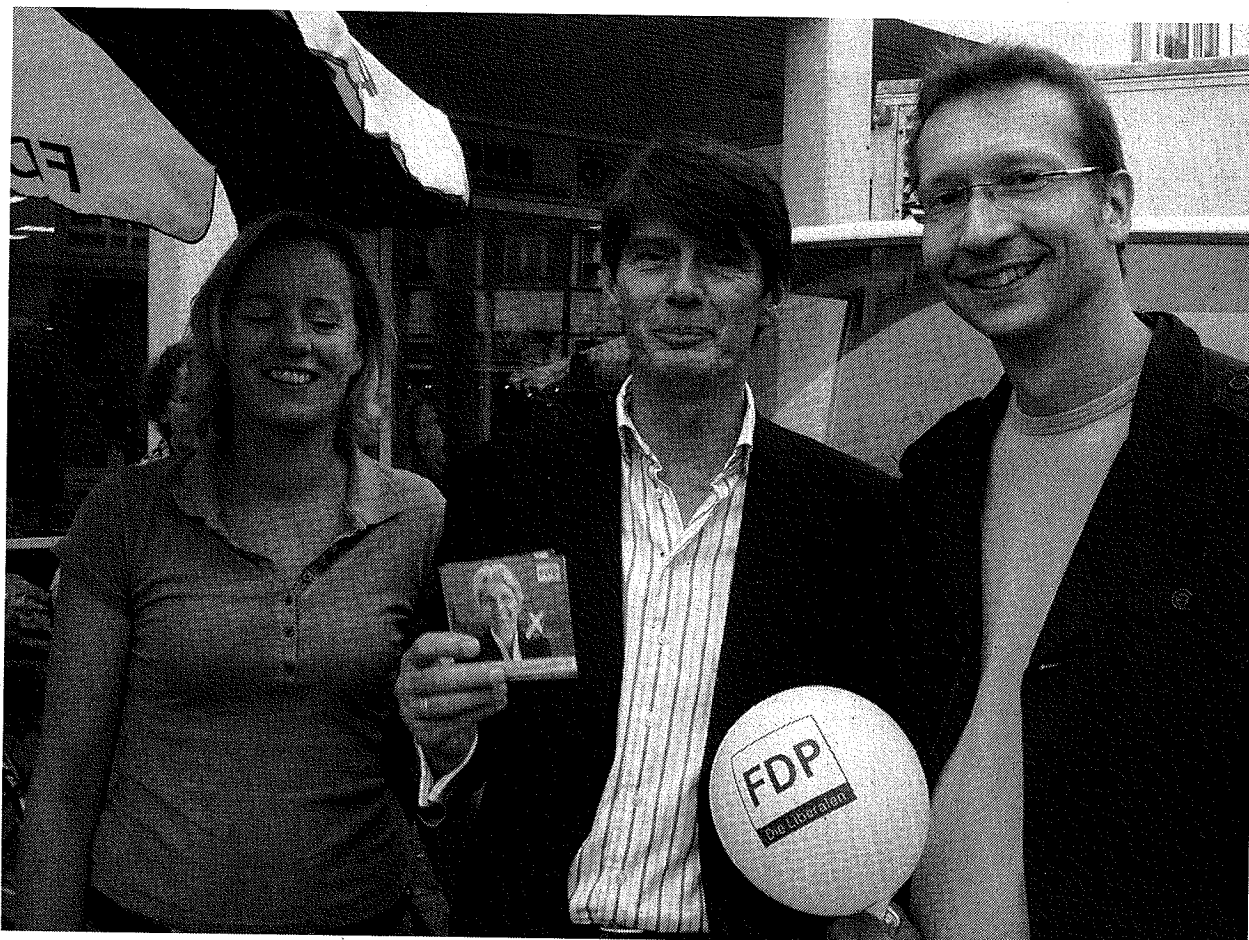
Reden nicht miteinander. Lassen sich vom Markt regeln.